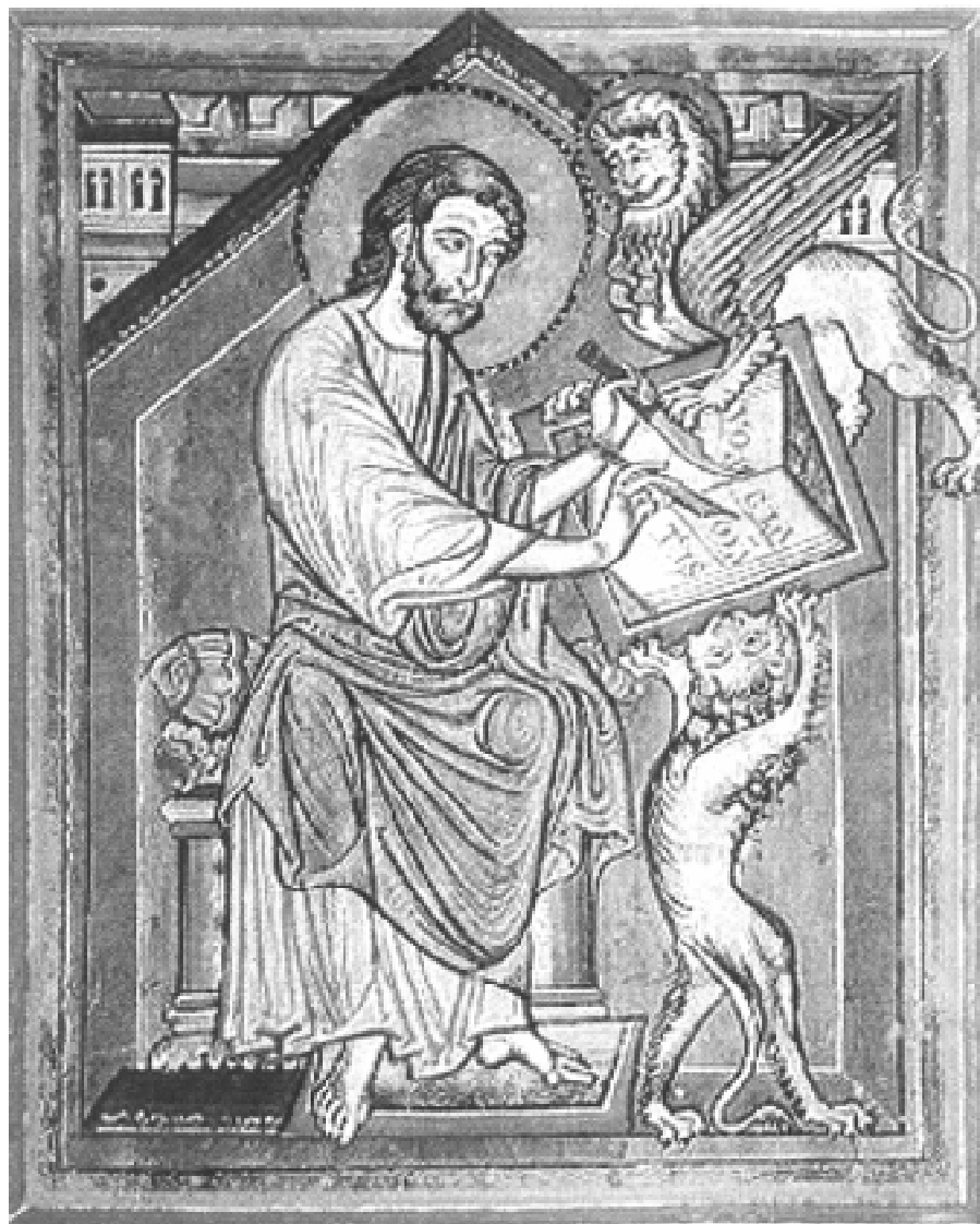
Święty Marek Ewangelista na średniowiecznej miniaturze

Żeglarze. Według tradycji św. Marek przepływał kiedyś w okolicy Wenecji i podczas sztormu udzielił pomocy miejscowym żeglarzom. Dlatego Wenecjanie obrali go za patrona, sprowadzili ciało Ewangelisty do miasta i wybudowali na jego cześć wspaniałą bazylikę. W sztuce weneckiej często św. Marek jest ukazwany z żeglarzami.