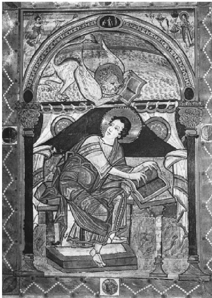
Święty Marek Ewangelista-Ewangelista z opactwa Saint Medard w Soissons. Szkoła pałacowa Karola Wielkiego, pocz. IX w.

Marek był uczniem św. Piotra i św. Pawła. Przez pewien czas towarzyszył św. Pawłowi w jego pierwszej podróży apostołskiej. Był też prawdopodobnie krewnym św. Barnaby. Być może dlatego właśnie przyłączył się do św. Pawła, który przybył do Jerozolimy z Barnabą. Jednak w trakcie podróży apostołskiej św. Pawła Marek opuścił go i zawrócił z drogi. Wywołało to rozgoryczenie Pawła, dlatego nie chciał go zabrać w swój drugą podróż. Wtedy i Barnaba opuścił św. Paw-